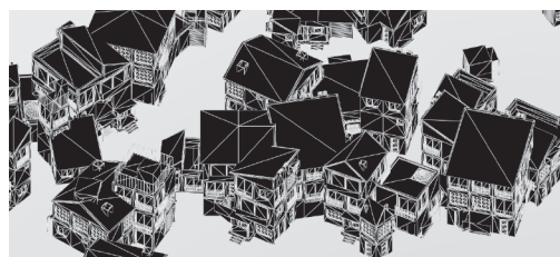
Generativity, LineKernell, 2015

Le Festival GAMERZ est proposé par l'association M2F Créations - Lab GAMERZ. www.lab-gamerz.com.