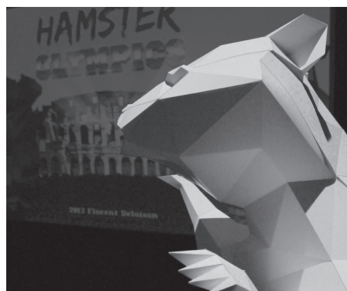
Quand les hamsters régnaient sur la terre - Florent Deloison

Créations visuelles : Elio Naute - Aladin Jouini - Maëlys Rebutini - Cyril Meroni Direction : Cyril Meroni Création sonore : 9th Cloud. Une création Hexalab - direction Pierre-Emmanuel Reviron En partenariat avec bype et Concept Even. Avec le soutien de la Fondation Vasarely, de la Région Provence-Alpes-Côte d'Azur, de la ville d'Aix-en-Provence et de la Communauté du Pays d'Aix. Un projet produit dans le cadre de la French Tech Aix-Marseille.